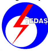
Türkiye Elektrik Dağıtım A.Ş.