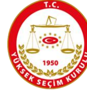
Yüksek Seçim Kurulu