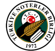
Türkiye Noterler Birliği